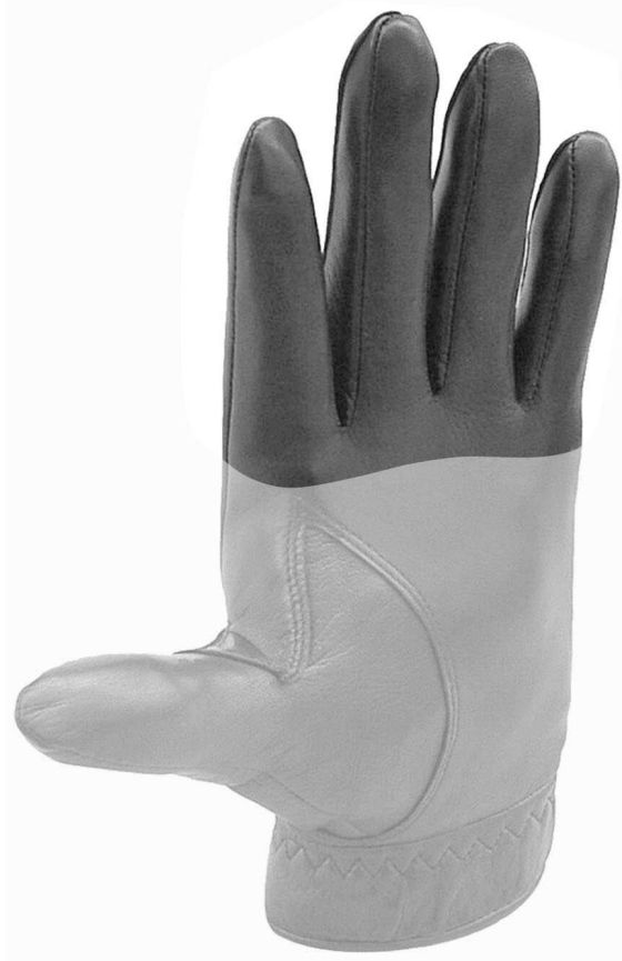
【 사시도 】 도면대용 사시사진

본원 장갑의 손가락 패턴 디자인은 단순한 손가락 형상을 탈피하여 손가락을 자연스럽게 펼친 형상에 의하여 시각적으로 미감을 느끼게 하는 것을 디자인창작내용의 요점으로 함.